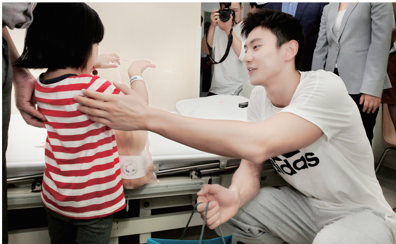
9月12日上午,游泳世界冠军宁泽涛在河南省人民医院心外科病房看望先天性心脏病患儿。当天,八方爱心人士希望——河南贫困先天性心脏病儿童救助计划“NU SKIN如新中华儿童心脏病基金”慈善救助项目在该院启动,河南省青少年发展基金会与河南省人民医院签订合作协议,借助该院小儿先天性心脏病学科优势,“NU SKIN如新中华儿童心脏病基金”将在10年内向河南省青少年发展基金会捐赠500万元,资助河南贫困家庭先天性心脏病患儿手术康复治疗。作为NU SKIN如新青春公益大使,宁泽涛已为先天性心脏病患儿捐赠了30台手术费用。

在此次培训中,授课专家讲解了国内外卫生应急管理现状、突发公共卫生事件应急法律法规、突发公共卫生事件现场流行病学调查报告、食品安全事故调查工作规范和技术指南、传染病应急预案管理与编制、传染病监测理论等,并就一些突发公共卫生事件的应急处置工作进行了分析与探讨。