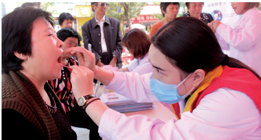
9月20日，栾川县卫生计生委、县疾病预防控制中心，组织全县10家口腔诊所、30名口腔医师开展义诊、咨询活动，增强人们的口腔健康意识，养成健康的生活习惯，预防口腔疾病。

此次活动向广大居民宣传了牙齿保健知识，以及牙病防治知识，帮助公众建立口腔保健的习惯，从而提高群众的口腔健康水平。（王正勤 高新科 李峰）