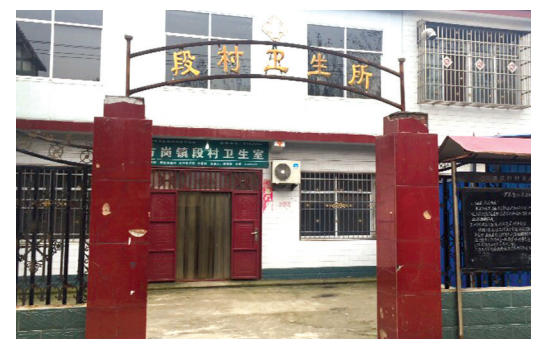
方岗镇段村卫生所

层医疗机构安装相关设备,涵盖和部分标准化村卫生所;已有300余位乡村医生进行了远程会诊,累计会诊500多人次。(本报综合摘编)