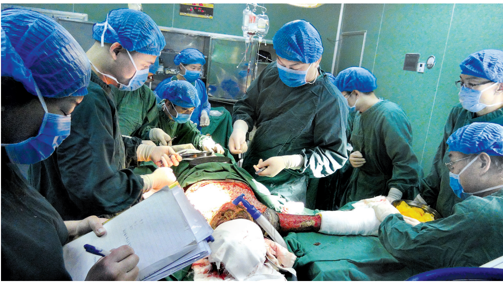
医务人员为烧伤患者做微粒皮移植