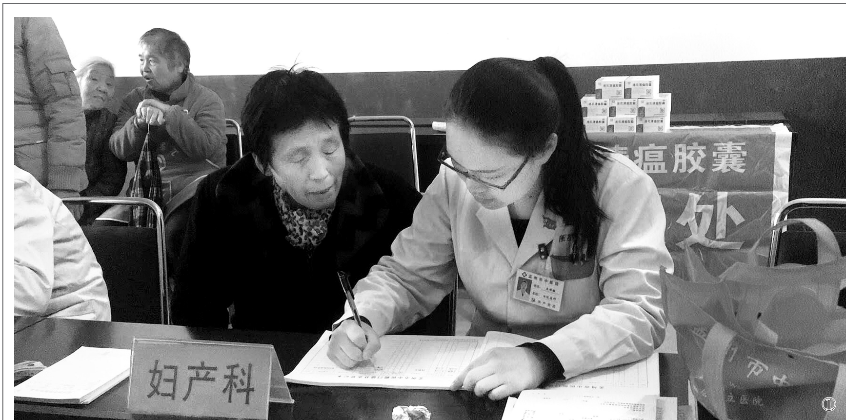
①10月17日,焦作市卫生计生委组织医务人员开展健康扶贫活动。