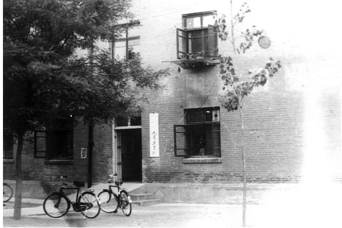
1957年,设在拖拉机厂职工宿舍楼内的医院

赢得了社会普遍赞誉,该院先后被评为“河南省群众百姓满意医院”“全国改善医疗服务示范医院”“全国百姓放心百佳示范医院”“全国百家改革创新医院”“河南省医院管理先进单位”等。