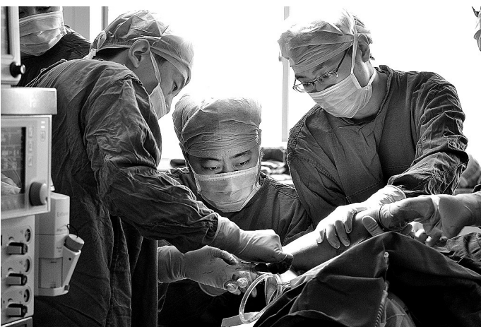
严于术前,慎于术中,精于术后

“60年风雨,涤荡出济世的赤子之心;60年征程,烙下不忘初心的坚持!”杨黎红说。60年厚重的历史,凝聚着几代“东方人”无悔的付出和忠诚的奉献,书写着几代“东方人”博大的情怀和崇高的爱,镌刻着几代“东方人”锐意改革、创业创新、不断超越的奋斗足迹。植根于民众、服务于患者、着眼于未来的洛阳东方医院,将以更加昂扬的姿态、奋发有为的精神、开拓创新的气魄、一如既往的济世仁心,造福一方!