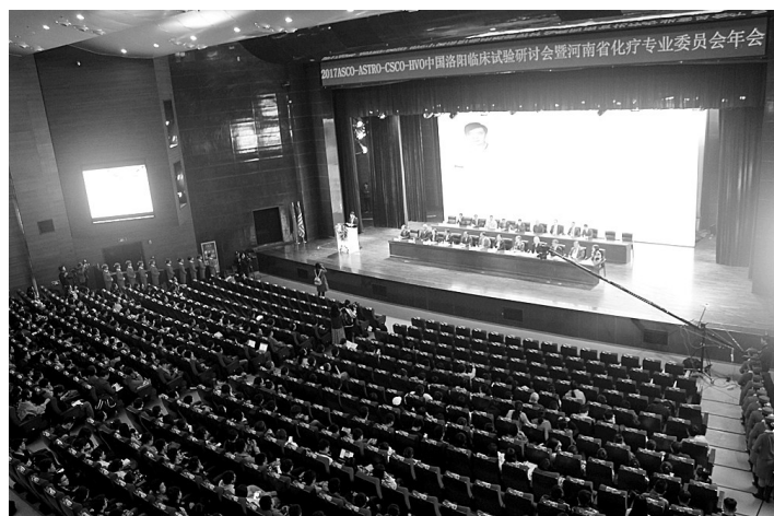
开幕式现场

本报讯(记者刘永胜 通讯员刘群 梁毅)秋风生洛水,红叶满洛城。10月21日,由美国临床肿瘤学会(ASCO)主办,河南科技大学医学院、河南科技大学第一附属医院承办的国际临床试验研讨会暨河南省抗癌协会化疗专业委员会年会在河南科技大学隆重开幕。