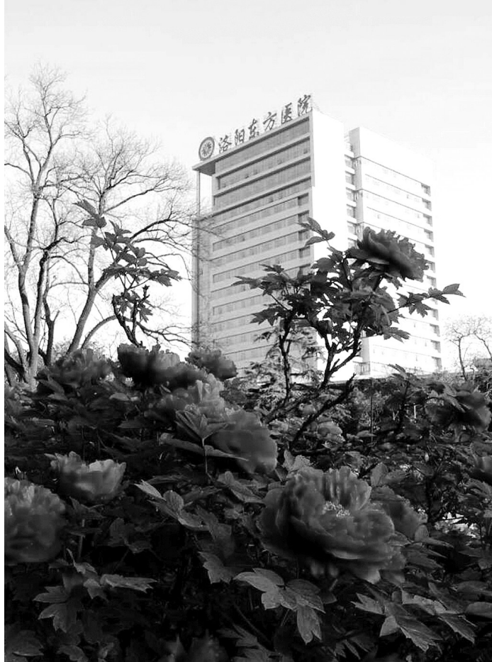
新建成的综合病房大楼与牡丹相伴

我们了解到,60年来,洛阳东方医院已承担社会责任作为全体医务人员不容辞的使命。洛阳东方医院常年开展扶贫救助和对口支援活动,与73家基层医疗机构建立医联体,通过技术帮扶、巡回坐诊、进修学习、捐赠设备等方式,提升基层卫生服务能力;定期开展“片医进社区”“健康快车进社区”义诊活动以及特殊群体义诊活动;通过多形式、多渠道普及健康知识,