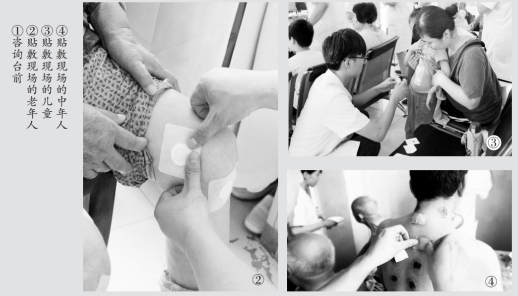
① 咨询台前 ② 贴敷现场的老年人 ③ 贴敷现场的儿童 ④ 贴敷现场的中年人