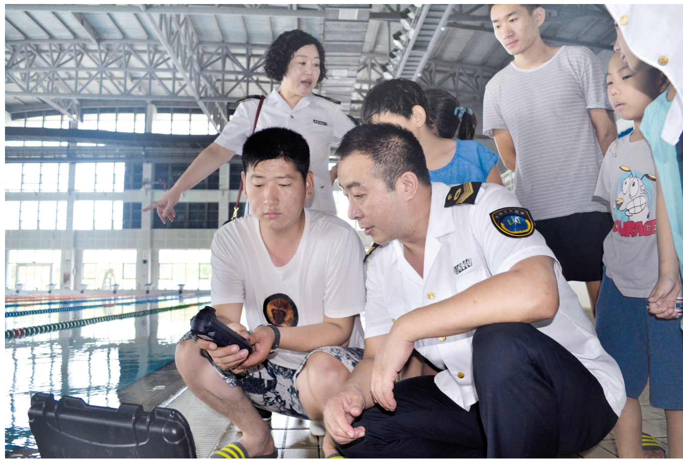
随着酷暑天气的到来,游泳池成为百姓消暑降温的好去处。日前,焦作市山阳区卫生计生监督所联合焦作市卫生计生监督局对辖区两家游泳场所进行了卫生专项检查,以确保公众能够享用到一个卫生、安全的游泳环境。

督导检查结束后,督导组指出,各级领导一定要高度重视卫生计生监督工作,增强卫生计生监督工作的责任感;要增强法治观念,强化日常监督检查工作;要履职尽责,有针对性地开展工作;要加强制度建设,强化内涵建设;要加强督导检查,有的放矢地进行检查指导;当地政府、卫生计生委要进一步加大扶持力度,加大资金投入力度,加强执法装备的配置,加强人员培训;要积极创造条件,更早地加入示范机构创建单位行列。