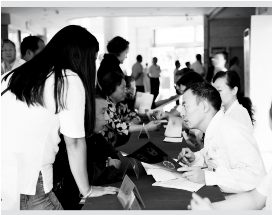
9月7日，河南科技大学第一附属医院“服务百姓健康行动”专家团来到孟津县人民医院。参加本次活动的专家涵盖骨科、妇产科、呼吸内科、儿科、心内科、眼科、消化内科、神经内科、内分泌科等9个专业科室。活动的主要内容包括义诊、指导查房、疑难病例会诊、实施手术、技术管理培训等。图为专家团义诊时的场景。

在经验交流专题讲座中，该院景华院区肾脏内科护士长王青苗带来的《慢性病管理中的健康教育——慢性肾病健康教育经验分享》，内容丰富，通俗易懂，引人入胜。参会人员会后纷纷前来咨询请教。