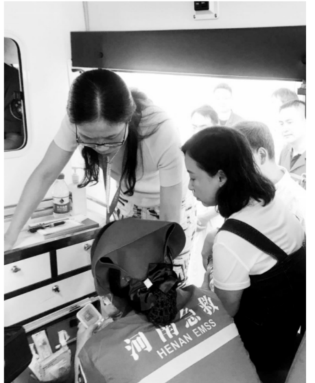
专家现场检查急救车和提问急救流程

胸痛中心最大的作用就是为急性胸痛患者提供快速诊疗通道，缩短急性胸痛患者的诊疗时间，提高救治成功率，为抢救赢取最