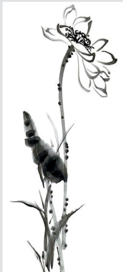
(本版未署名图片均为资料图片)

医院安全文化是医院文化的重要组成部分,是医院文化的一个重要分支。医院安全文化的内涵包括安全理念文化、安全制度文化、安全物质文化和安全行为文化。它是保护人的身心健康、尊重人的生命、实现人的价值的文化,是医院现代化安全管理的重要内容,是保证医院科学发展、安全发展的重要举措。