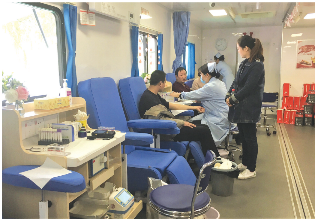
10月26日,河南省红十字血液中心在登封市正式启用郑州首台献血车。这一献血车车内有初筛区、体检区、采血区等分区,相当于一个小型血液中心,为登封市无偿献血相关工作搭建了又一便捷化平台。与传统的献血车相比,它支撑稳定,空间大,区域划分明确,且相对独立,采血设备功能先进、完善。在献血车试运行的一个月内,约有1000人在此献血;便利、温馨的献血环境,获得了无偿献血者的好评。

省卫生计生委要求,各地、各单位要加强组织领导,深刻领会卫生监督文化建设的重要意义,并将其列入重要议事日程,把卫生监督文化建设持续推向深入;要创新方式方法,把卫生监督文化建设体现到卫生监督执法的方方面面,不断增强卫生监督文化的感染力、凝聚力和号召力;要总结和提炼卫生监督文化建设的好做法、好经验,不断提升卫生监督文化建设水平,引领全省卫生监督事业不断前进。