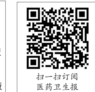
扫一扫 医药卫生报