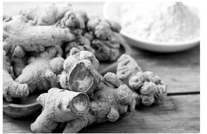
本版图片为资料图片