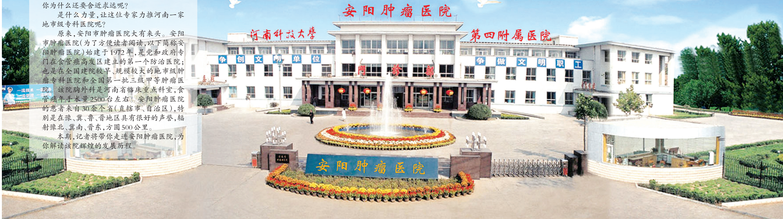
↑图为安阳肿瘤医院门诊楼,该楼2017年被安阳市政府评为“历史文化建筑”。该建筑由我国著名建筑设计师王庭惠主持设计。