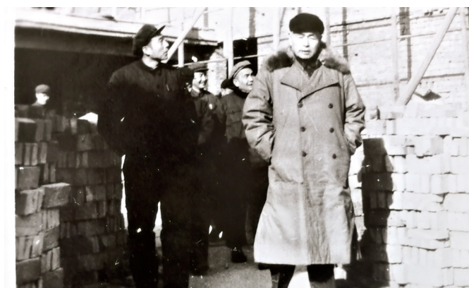
原卫生部副部长钱信忠在安阳肿瘤医院建筑工地视察