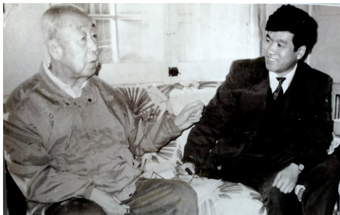
吴英恺院士回忆在医院工作过的时光