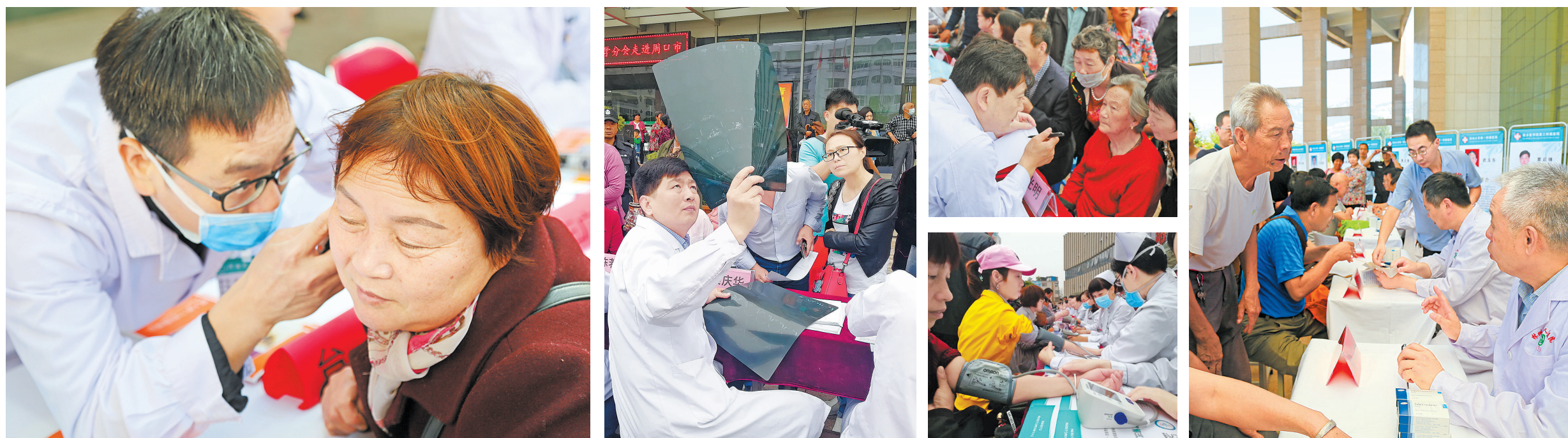
河南省医学会“名医名家走基层·送健康”义诊现场