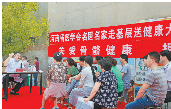
医学专家为村民们宣传骨科常见病防治知识