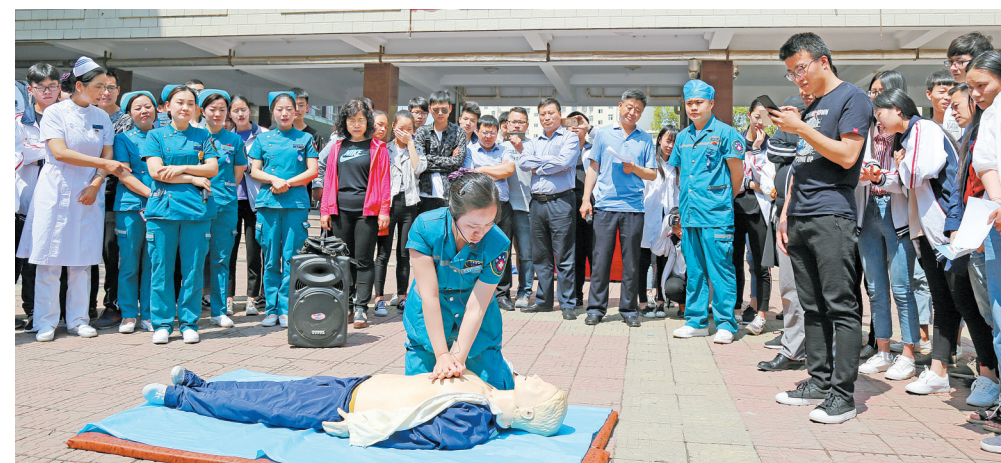
护理专家走进商丘市实验中学，为师生们演示急救方法。