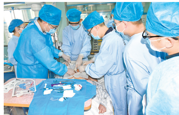
百项基层适宜技术推广项目手术演示