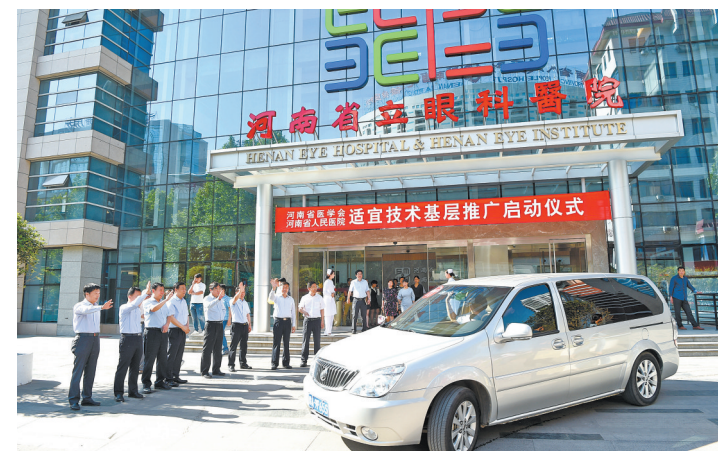
百项基层适宜技术推广项目启动仪式

以巩义市人民医院为例，自去年5月起，河南省人民医院麻醉专家在该院进行超声引导下神经阻滞术培训后，巩义市人民医院麻醉科23名成员均掌握了此技术，自去年9月开始，巩义市人民医院每月完成超声引导下神经阻滞术200多例，减轻了很多患者的术后疼痛。