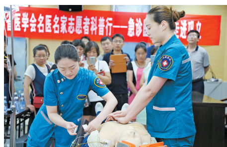
百项基层适宜技术推广项目活动现场