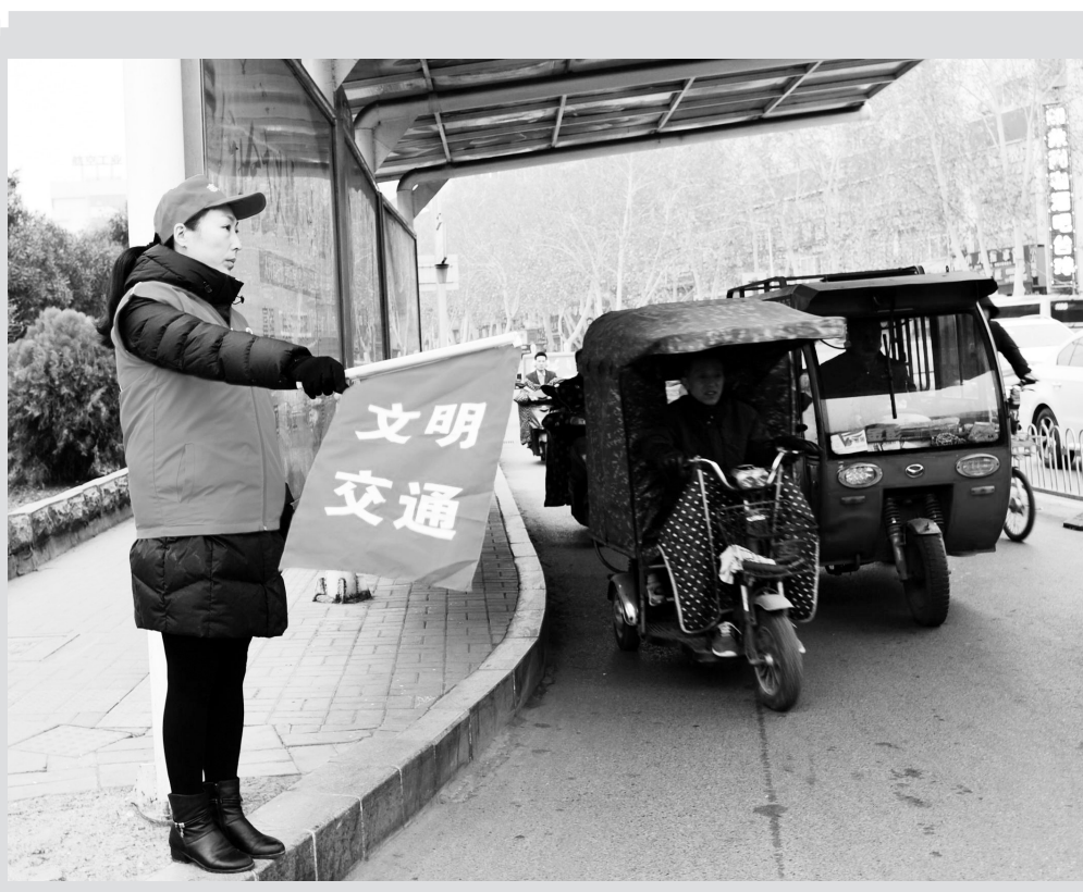
3月1日至5月2日,洛阳市妇幼保健计划生育服务中心、市计生协会将派出32位志愿者分为8组,在早晚两个交通高峰期,到解放路凯旋路口协助交警维护交通秩序。图为3月1日7时30分,志愿者服务时的情景。

孟津县中医院脑病科是县级重点专科,省中医脑病协作组成员单位。目前,该病区设置病床50张,重点开展脑病科常见病、多发病的诊疗,特别是脑梗死的急性期溶栓治疗、急性期脑梗死