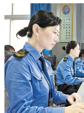
卫生监督 巾帼风采

五年来,全省卫生监督各项工作取得了翻天覆地的变化,卫生监督户次、监督覆盖率、执法办案数量等主要指标连续5年位居全国前5位,整体实力跻身全国第一方阵。这些成绩的取得,离不开这群细致、敏感、认真、感性、韧性的女卫生监督员的不懈奋斗。