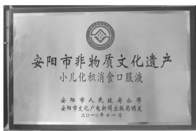
非物质文化遗产奖牌