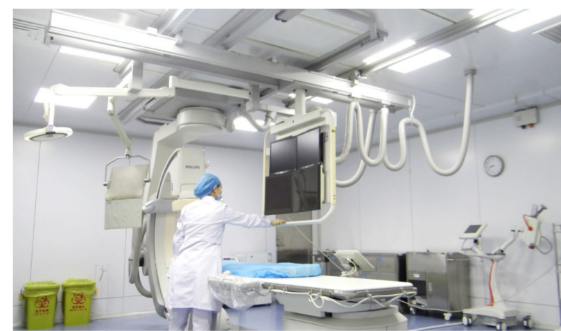
先进的数字减影血管造影机