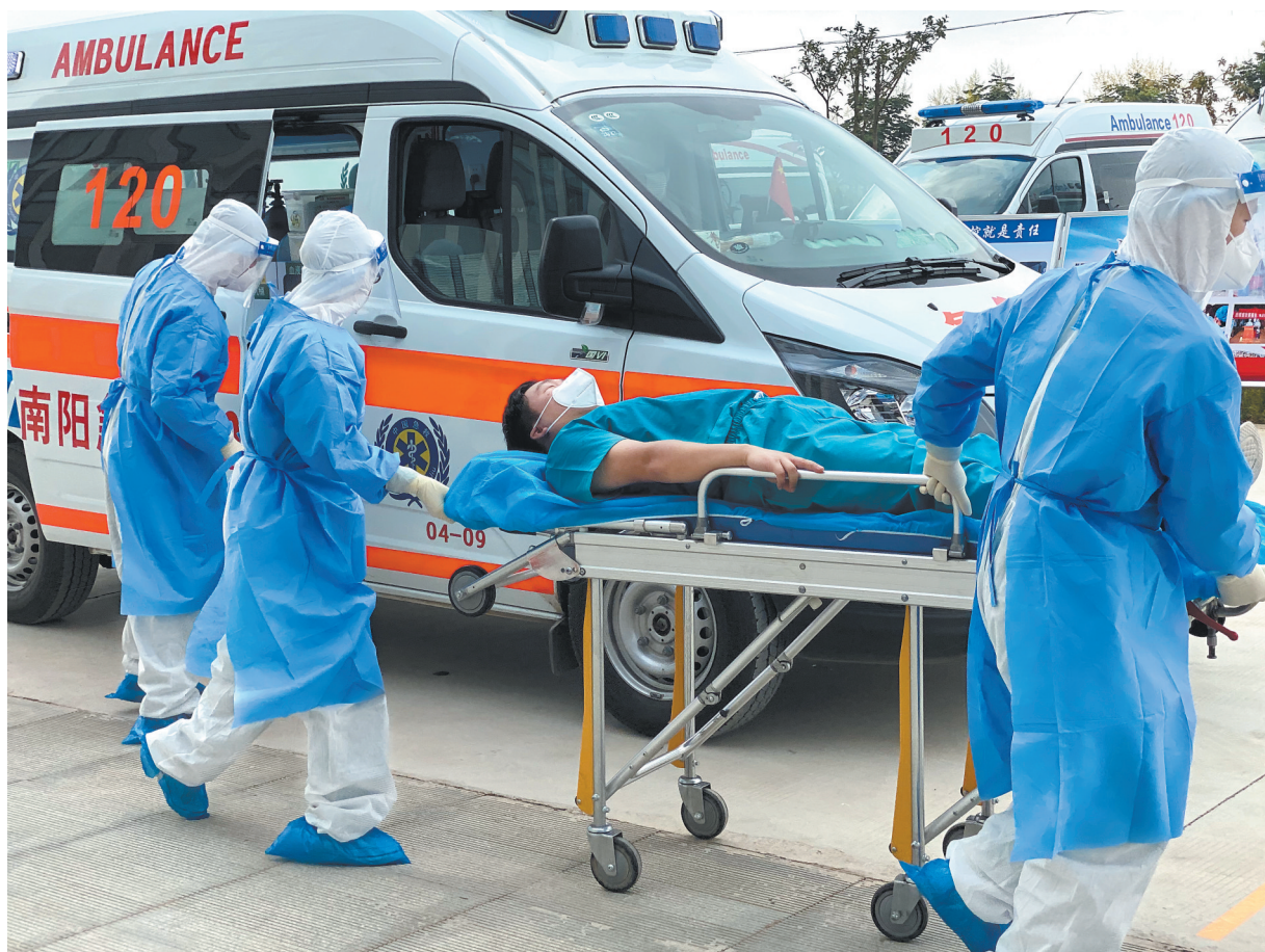
8月11日上午，南阳市卧龙区医务人员模拟转运“新冠肺炎确诊患者”。当天，卧龙区卫生健康委在区中医院进行秋冬季新冠肺炎疫情应急处置演练。此次演练模拟发现新冠肺炎病例后，卧龙区卫生健康系统应急分队和医疗机构按照相关方案要求进行综合性应急处置，进一步提高应对新冠肺炎疫情的防范意识和应急水平，规范防控和应急处置流程，全面增强防控救治队伍的协同配合、应急指挥、综合协调能力，为群众的生命安全和身体健康提供坚实保障。

国家卫生健康委职业健康司副司长王建东、河南省卫生健康委副主任黄虹霞及全国16个省份职业健康工作相关负责人参加此次培训班。