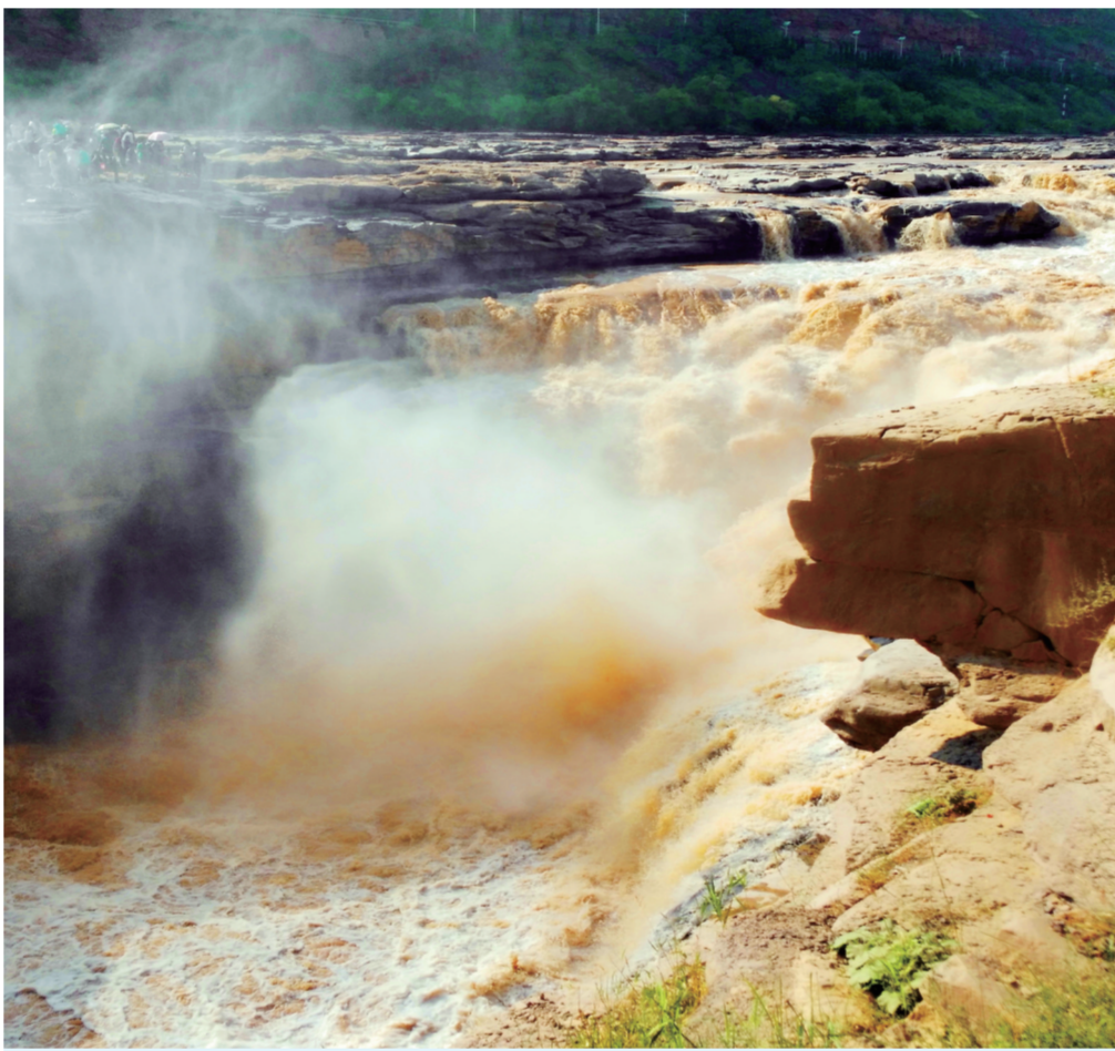
黄河之水天上来 作者供职于河南省卫生健康宣传教育中心