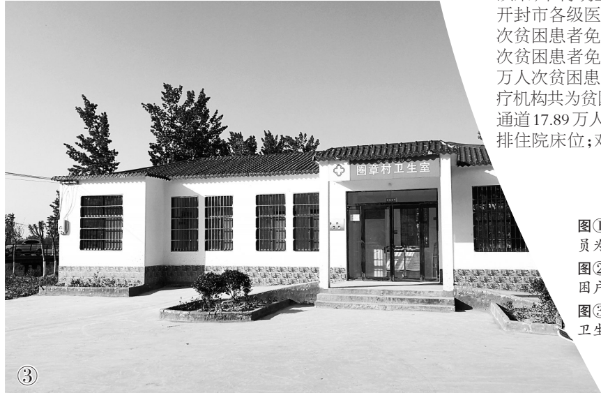
图①健康扶贫工作人员为贫困户讲解政策 图②专家团队深入贫困户家中义诊 图③新建的标准化村卫生室