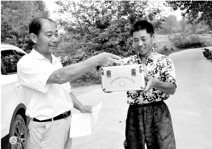
图①医疗服务进万家 图②发放爱心药箱