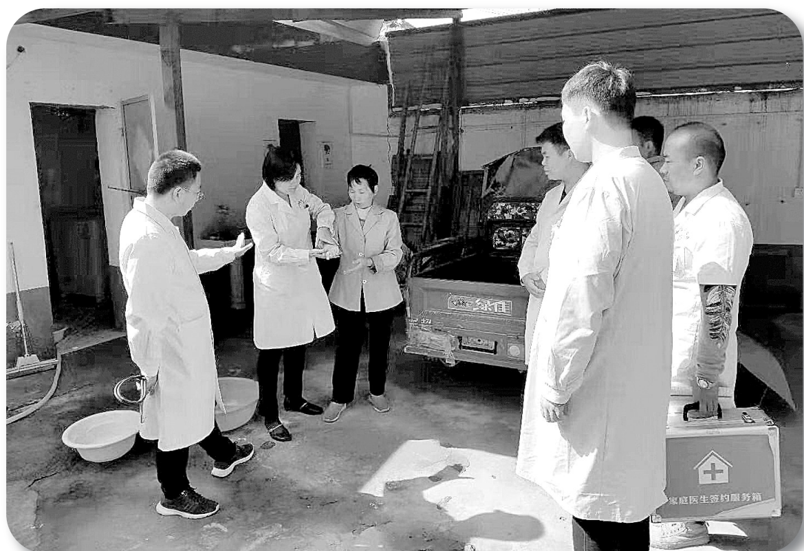
家庭医生签约服务团队上门服务