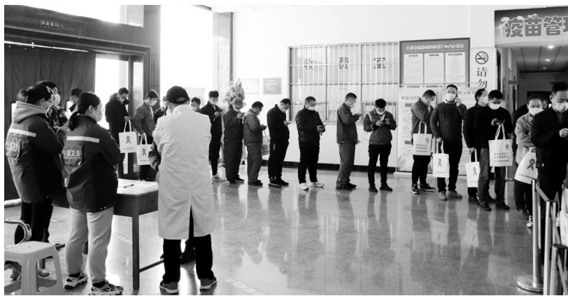
为加快新冠病毒疫苗接种进度,3月25日,孟州市疾病预防控制中心全面开展接种工作,当天接种疫苗513剂次,疫苗库存清零。