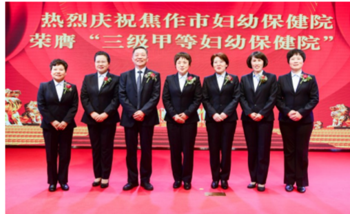
团结奋进的领导班子

焦作市妇幼保健院还承担着焦作市的妇幼保健公共卫生职能。多年来，经过焦作市各级妇幼保健机构的共同努力，焦作市住院分娩补助项目和农村妇女增补叶酸预防神经管缺陷项目有序完成；预防艾滋病、梅毒、乙肝母婴传播项目有序开展；孕产妇、