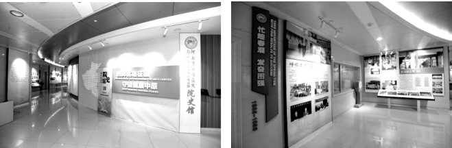
河南省肿瘤医院史馆

河南省肿瘤医院是一所拥有44年历史，现已成为集医疗、科研、教学、预防、康复为一体，河南省标志性三级甲等肿瘤专科医院。在医院44年发展历程中，医院党委把院史文化作为医院发展的“根”和“魂”，注重挖掘、提炼和传承院史文化，顺利建成院史馆，在今年建党100周年之际，结合党史学习教育，开展以“回眸抗癌征程 守望健康中原”为主题活动，把院史馆进行扩建亮相，打造文化和精神家园，时刻激励着全院广大职工传