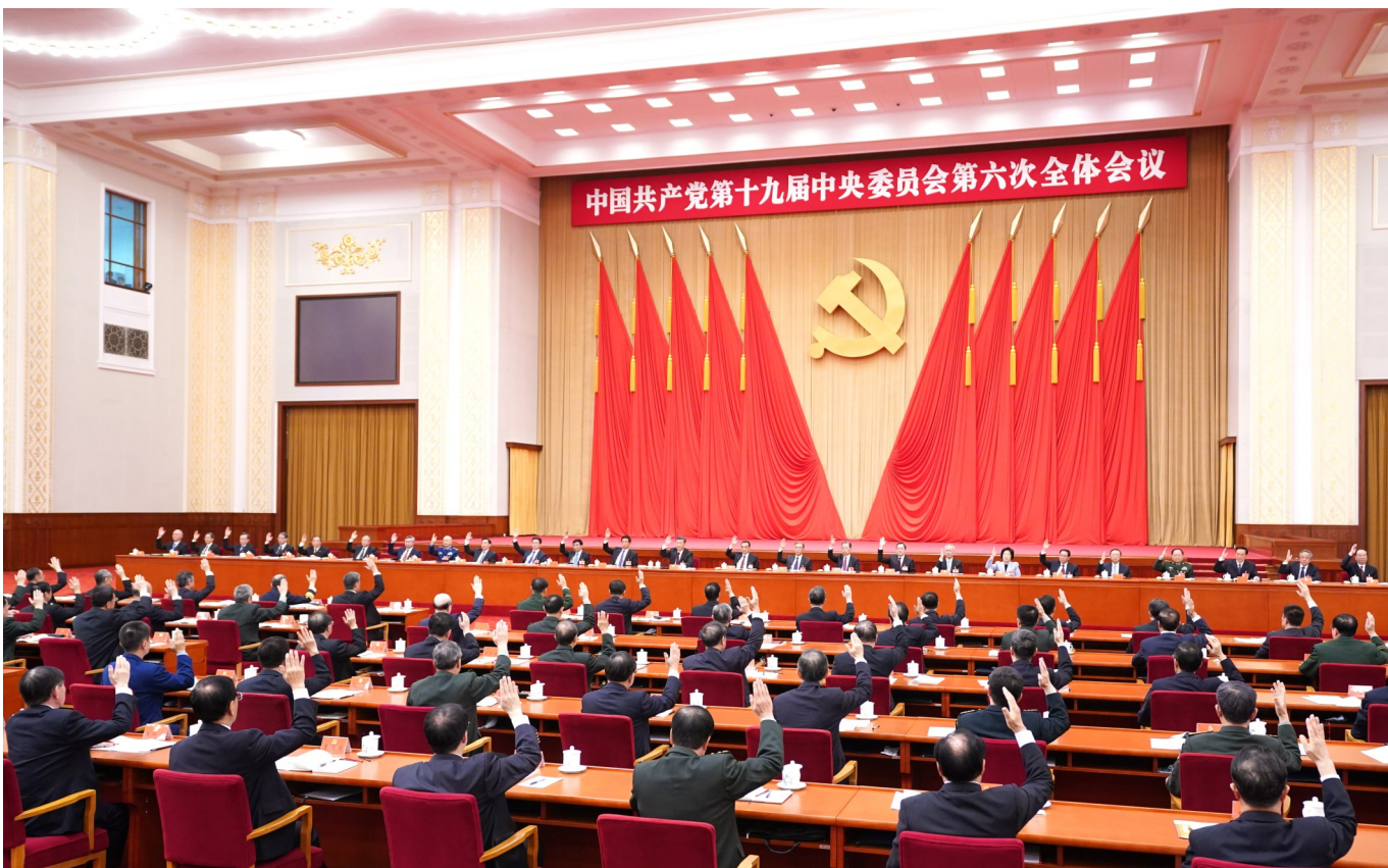
中国共产党第十九届中央委员会第六次全体会议，于2021年11月8日至11日在北京举行。中央政治局主持会议。