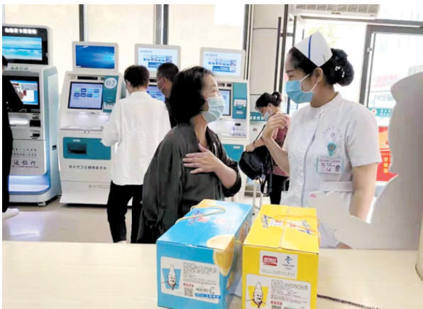
张老太太给门诊送来两箱点心