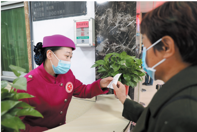
耐心为就诊患者解答疑问

“我们以河南省提升医疗服务十大举措为引领,以智慧服务建设为抓手,推动信息技术与医疗服务深度融合,根据门诊实际情况和患者需求,创新工作方法,适时启动‘天使之音’广播系统,提升了服务效率和门诊服务质量。”新乡市第一人民医院院长翟成凯说。