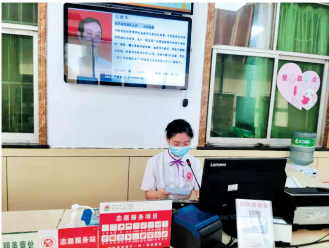
“天使之音”广播系统