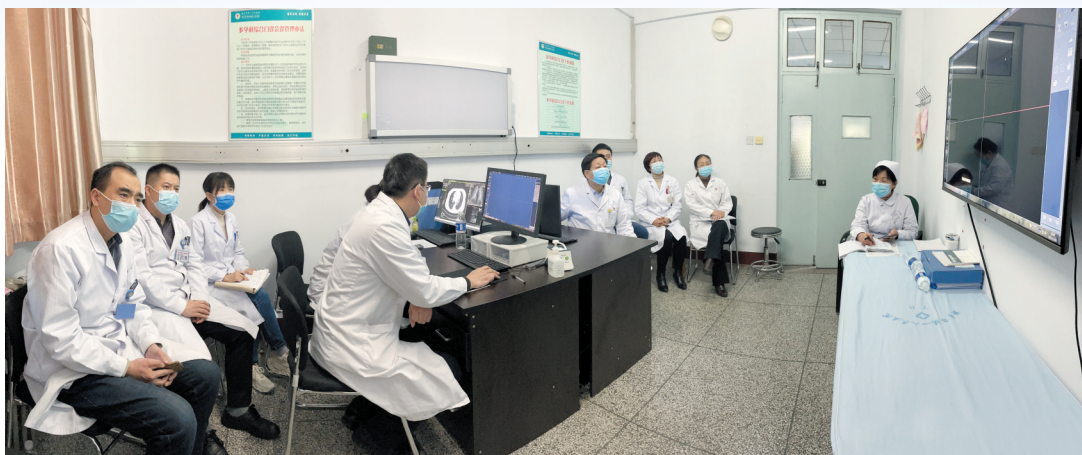
肺结节多学科会诊