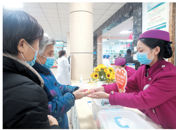
为患者免费提供爱心箱里的糖果