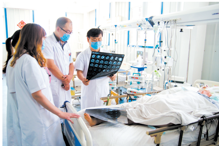
党支部书记带队会诊