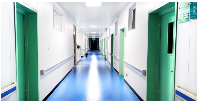
干净卫生的诊疗环境