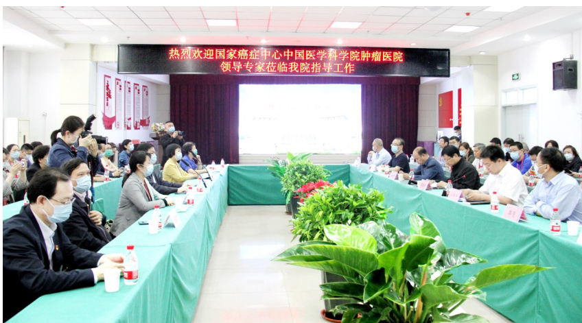
中国医学科学院肿瘤医院专家来林州市食管癌医院指导工作