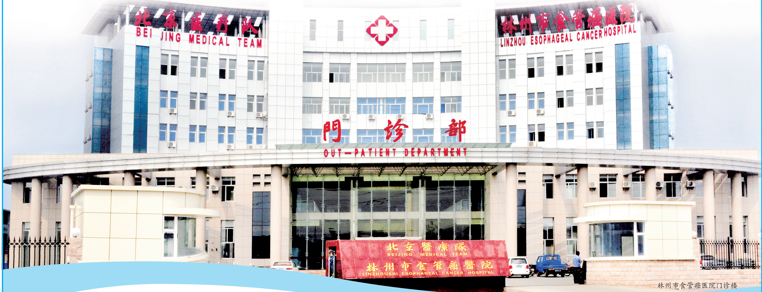
林州市食管癌医院门诊楼

2021年3月7日,河南省卫生健康委印发《河南省提升医疗服务十大举措(2021年版)》的通知,要求各级卫生健康行政部门(含中医药主管部门)和医疗机构要提高政治站位,充分认识提升医疗服务的重要意义,并将其作为卫生健康领域开展党史学习教育“我为群众办实事”实践活动的主要内容,实行“一把手”负责制,推动各项便民惠民措施落地见效,进一步增强人民群众看病就医获得感。