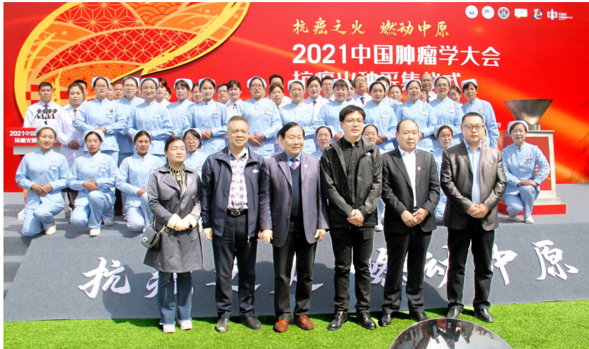
该院医务人员参加“2021年中国肿瘤学大会”火种采集仪式