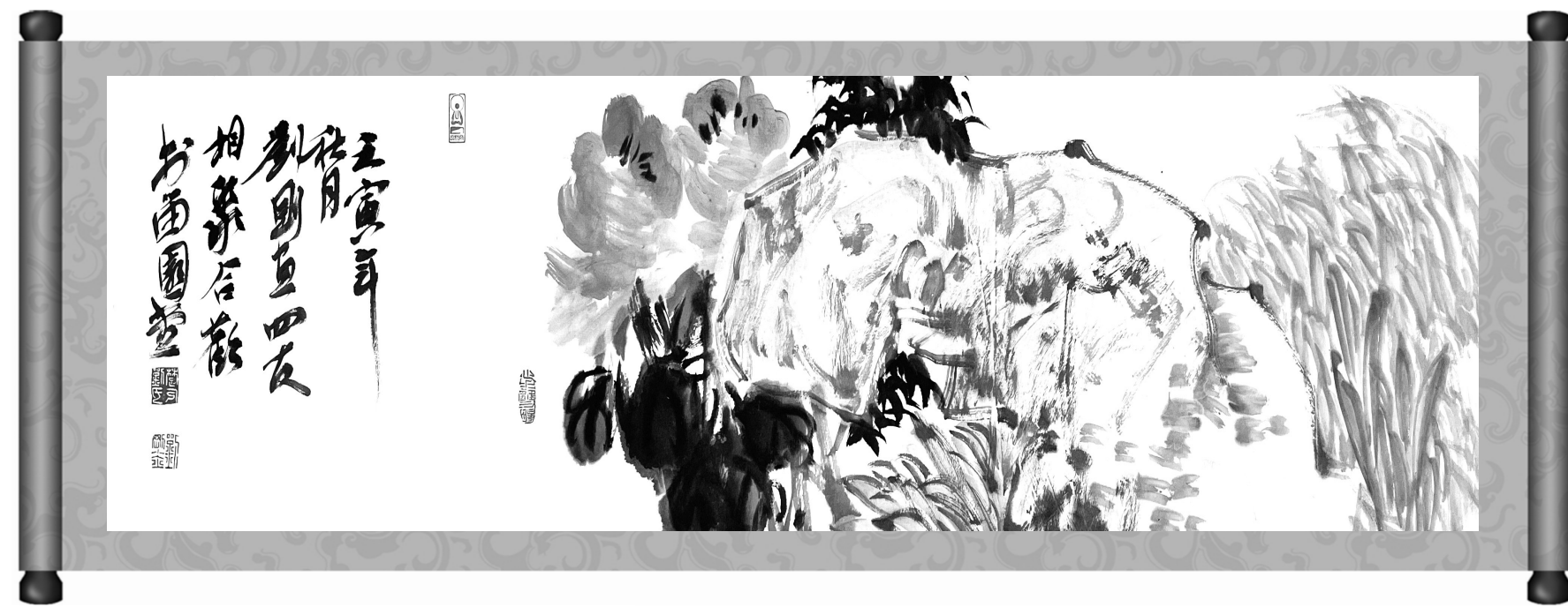
刘刚/作 作者供职于新密市中医院