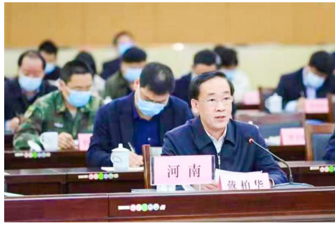
2021年4月,时任副省长戴柏华代表河南在全国爱卫工作会议上进行“一科普六行动”的经验介绍

“一科普六行动”是2020年河南省根据新冠疫情防控需要,创新实施的新时代爱国卫生运动的一大新亮点。其重点围绕环境卫生综合整治、健康促进、基层卫生健康治理三大领域,统筹推进健康科普知识普及宣传,重点场所(工作场所、校园、市场、车站、乡村基层、社区一线)环境卫生整治及病媒生物预防控制工作六大专项行动,助力了河南打赢了疫情防控阻击战,巩固了全省疫情防控重大战略成果。此项活动得到国务院副总理孙春兰的批示肯定,全国爱国卫生运动委员会办公室主任吴翔天专程率队到河南调研总结经验。