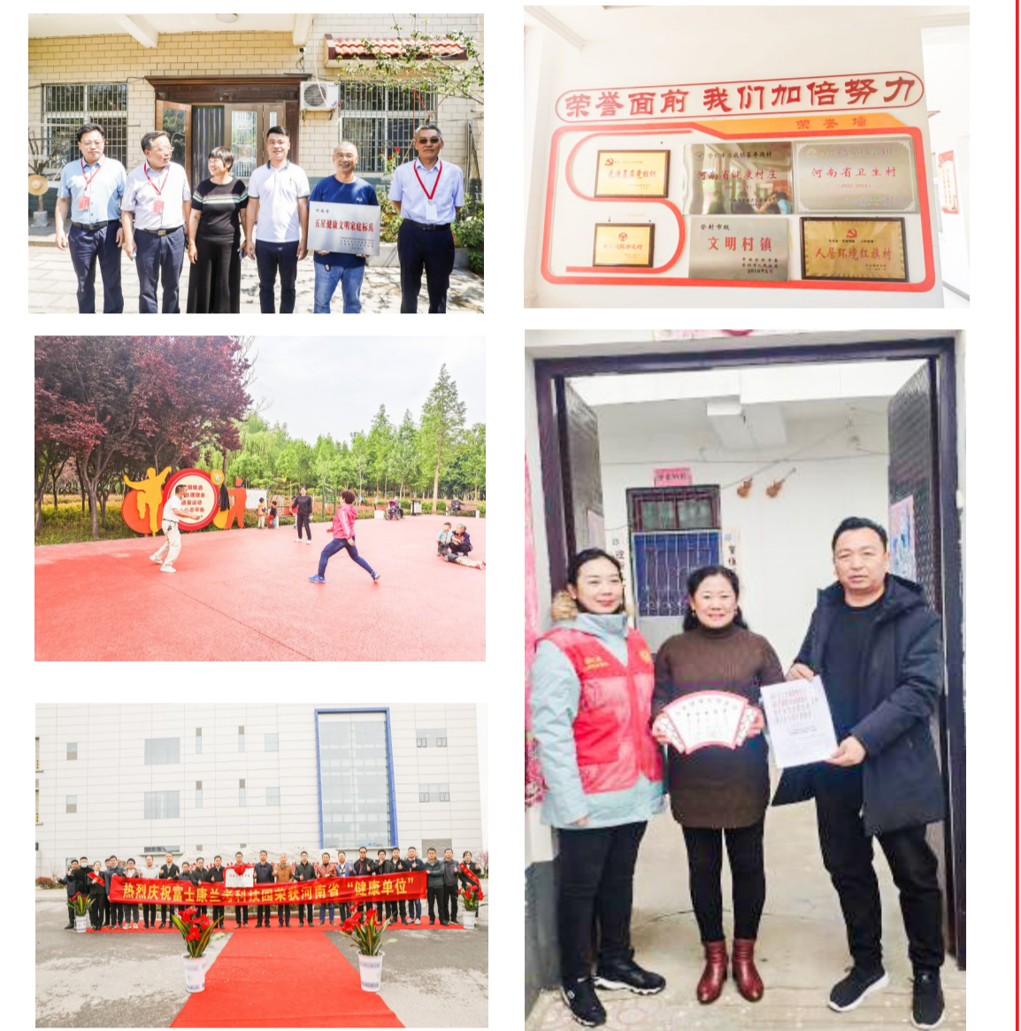
健康乡镇、健康村庄、健康单位、健康企业、五星健康文明家庭

自2018年以来,河南在认真总结卫生乡村创建和健康帮扶工作经验基础上,考虑到全面小康社会居民的新期盼、新需求,结合乡村振兴战略、健康中原行动、农村人居环境整治行动等,于2020年正式启动健康细胞建设试点工作。试点工作着重从建设健康环境、优化健康服务、普及健康生活、加强健康文化、完善健康保障等方面加强政策支持,健全标准规范,强化组织推动。截至2021年年底,河南已命名省级健康乡镇157个、健康村庄429个、健康单位1024个。