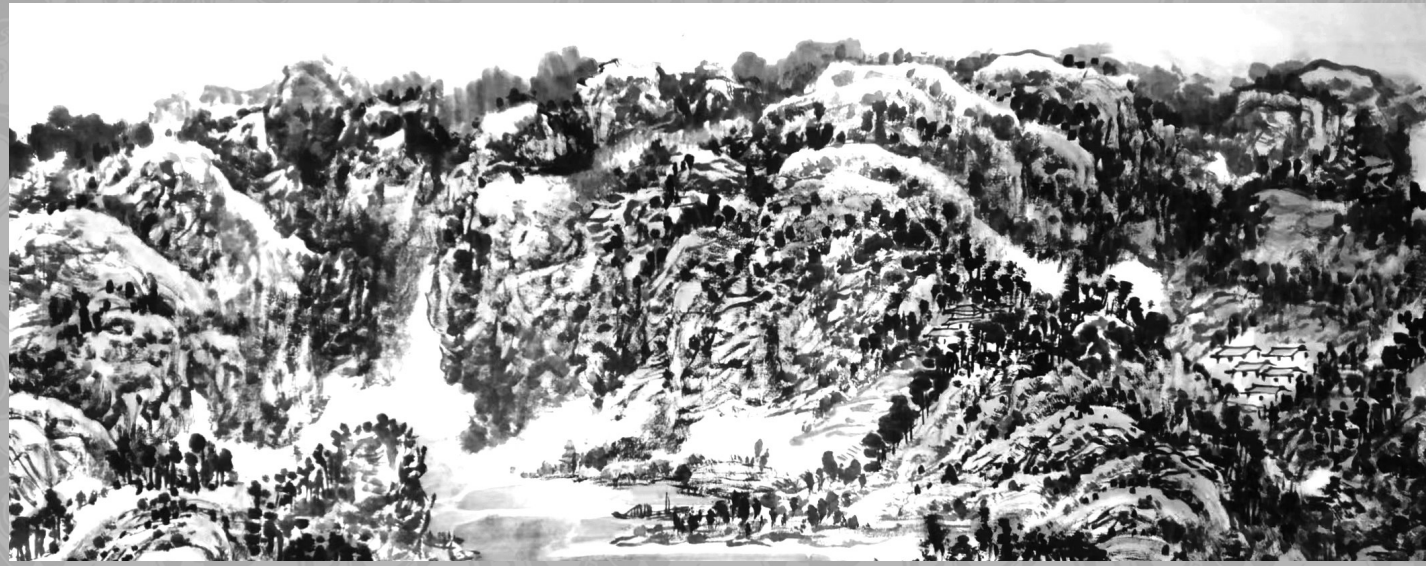
刘刚/作 (作者供职于新密市中医院)