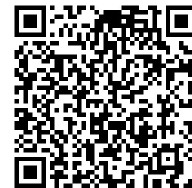
（扫描二维码，了解详细名单）

集体和先进个人为榜样，锐意进取、勇毅前行，笃行不怠、务实工作，在新征程中推进老齡健康工作高质量发展，为加快健康河南建设作出新的更大贡献。