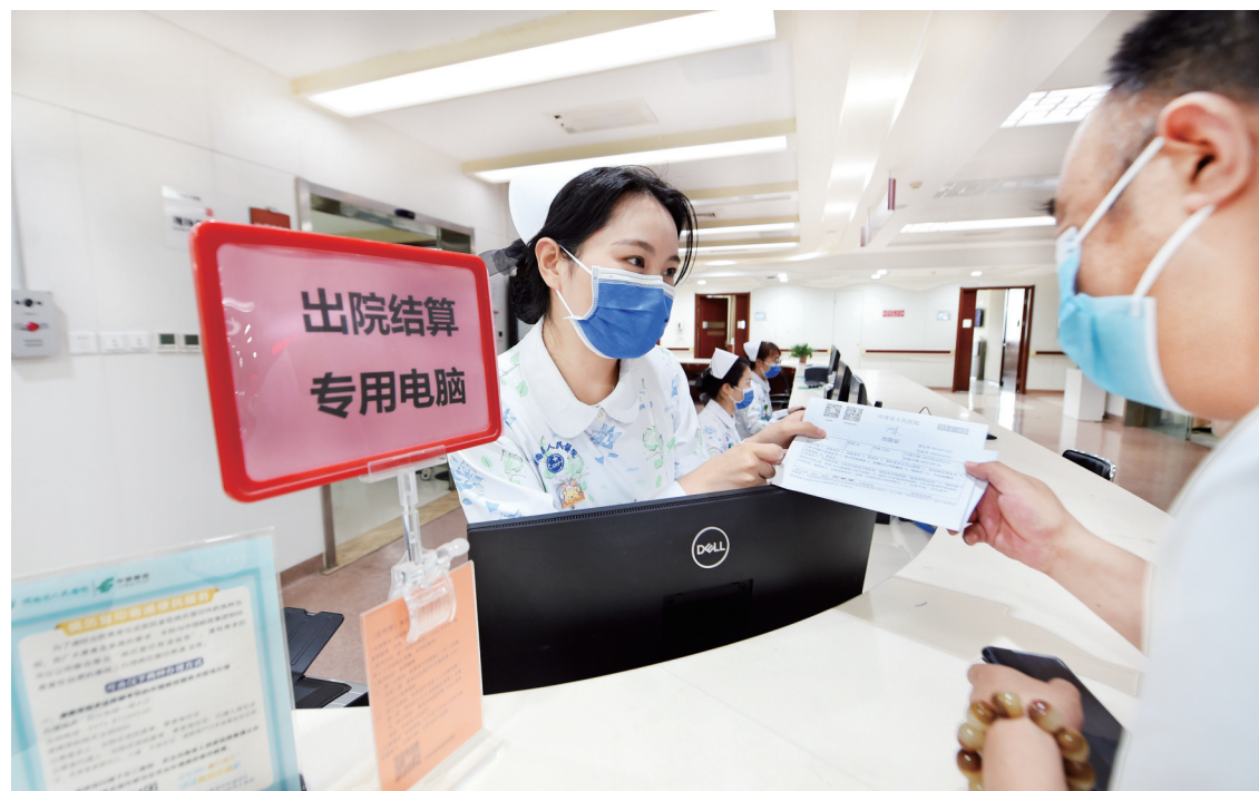
在河南省人民医院，一位患者在消化内科一病区办理出院。