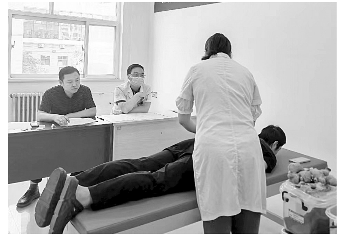
9月19日,在濮阳市中医医院,医务人员进行拔罐操作。9月18日~19日,该院举办2023年中医药岗位技能竞赛。此次技能竞赛内容包括腧穴定位与取穴、常用针刺操作、隔物灸、拔罐、常用推拿手法等,进一步营造以赛促学、以赛促练、以赛促用的浓厚氛围。