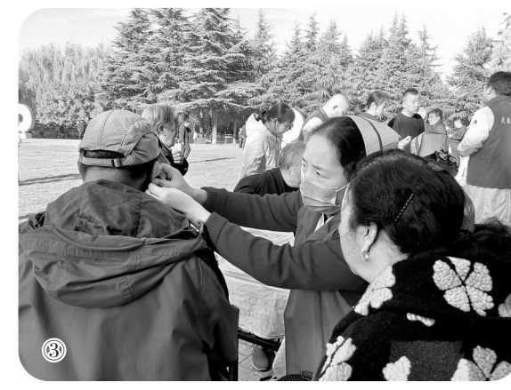
敬老月活动 义诊现场