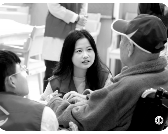
敬老月活动 义诊现场

该院肿瘤医院也开展了形式多样的系列主题活动,为老人赠送茱萸香囊、分发健康糕点。医务人员还特别编排了舞蹈《感恩的心》,演唱歌曲《歌唱祖国》。