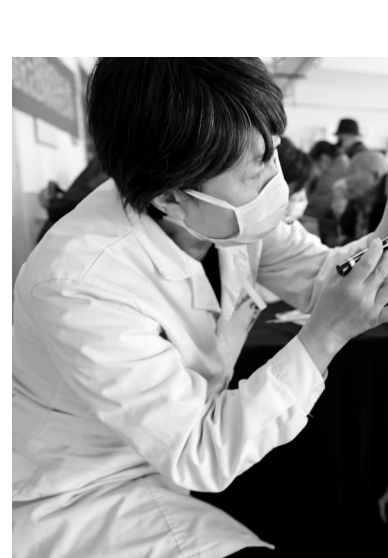
新医一附院为老人送健康

本报讯(通讯员宋鹏 陈超 杨智华)怎样健康度过晚年生活?老人如何保护好牙齿?怎样科学服药?近日,新乡医学院第一附属医院组织专家前往新乡市颐和源养老公寓,开展敬老月健康科普及义诊活动(如下图)。在该院肿瘤医院,医务人员为老人送上了茱萸香囊、健康心愿卡等,表达祝福。