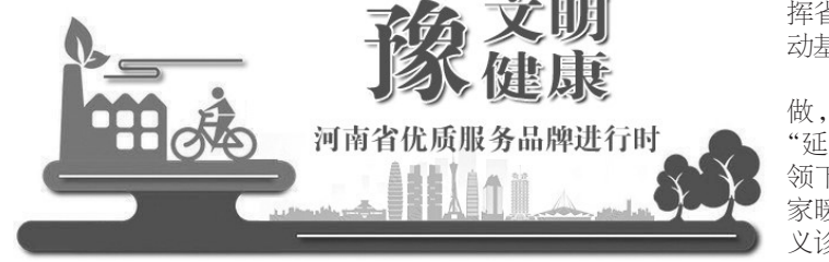
豫文明健康 河南省优质服务品牌进行时

扶危助困 推动中医药文化发展传播 河南中医药大学第一附属医院帮扶困难学子,以志愿服务为纽带,开展相关服务项目;设立延泰基金,建立“寻求外来资金帮扶”“院内结对帮扶”“自立自强勤工俭学帮扶”三方联动的扶危助困机制,目前已筹集捐款90余万元,帮扶学生60人;践行“奉献、友爱、互助、进步”的志愿服务精神,志愿者坚持走访慰问困难学生家庭。河南中医药大学第一附属医院持续推动中医药文化进校园,已与7家中小学合作共建“中医药文化进校园”项目,综合提升提升迈入全国前列。