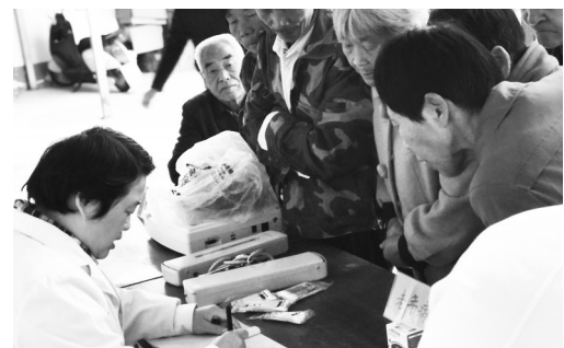
专家义诊