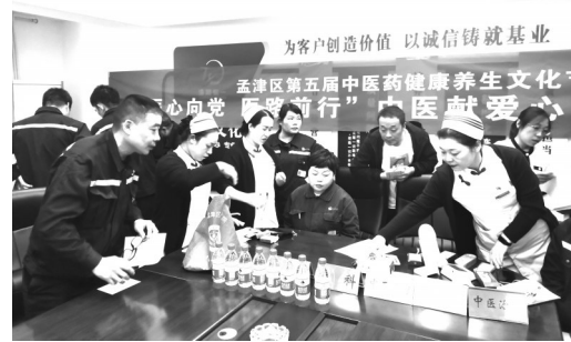
中医药文化进企业