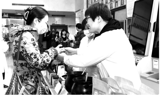
中药代茶饮品尝活动