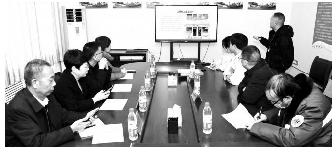
村级“吹哨人”进行工作汇报