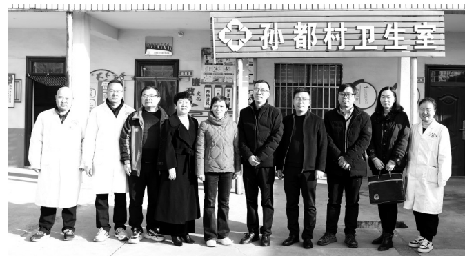
评审验收专家与基层“吹哨人”在一起