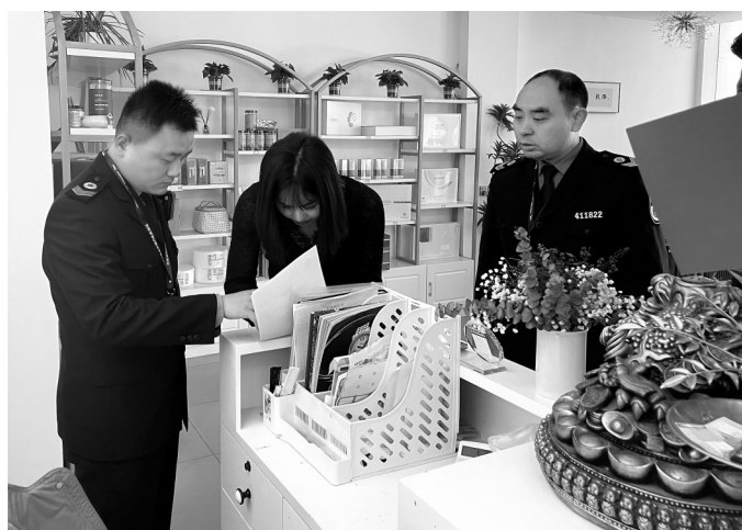
4月9日,在舞钢市一家美容美发店,卫生监督人员向店主下达卫生监督意见书。连日来,舞钢市卫生健康技术服务中心的工作人员对美容美发店等公共场所进行卫生监督检查,确保游客健康出游。