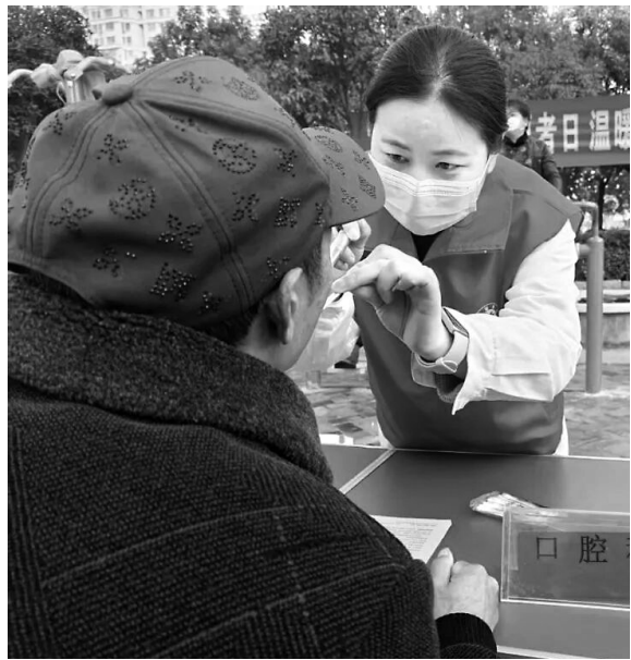
↑12月5日，在息县淮桥社区息州广场，志愿者为群众检查口腔。当天，息县中心医院组织医疗志愿者服务队开展“温暖回家路，义诊暖人心”主题公益活动，将便捷专业的医疗服务送到居民家门口。

濮阳县人民医院志愿服务队将以此次活动为契机，持续深化“进社区、下基层、进校园”志愿服务模式，常态化开展健康义诊、科普宣教、心理援助等活动，让专业医疗资源扎根基层。