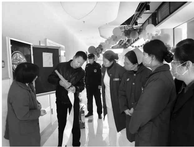
↑12月4日，在灵宝市第二人民医院，消防安全员为职工讲解消防器材的正确操作方法及注意事项。当天，该院组织开展了实战化消防演练活动，进一步提升职工的消防安全意识和应急处突能力。

下一步，西平县卫生健康委将持续优化审核发放流程，强化服务保障，推动育儿补贴政策落地见效，切实减轻家庭育儿负担，为建设和幸福西平筑牢民生保障根基。