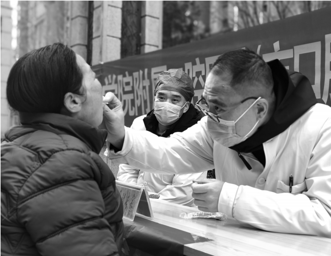
↑近日，在平顶山市湛河区九里山街道银基小区，医务人员为群众检查口腔。当天，平顶山学院附属口腔医院（市口腔医院）组织医疗团队开展以“不忘初心，志愿有我”为主题的系列爱心服务活动，将优质的口腔健康服务送到居民家门口。

此外，舞阳县爱卫中心通过发放宣传资料、设立集中宣传点等多种形式，广泛宣传灭鼠灭蟑工作的重要意义，增强群众防病意识和自我保健能力，充分调动群众参与积极性、主动性和创造性，引导广大群众自觉投身卫生死角清理、滋生地治理工作，共同推进冬季灭鼠灭蟑活动深入开展。