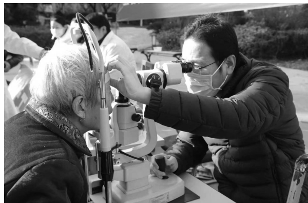
↑近日，在焦作市解放区七百间街道陶瓷路社区郁金香苑小区，医务人员为群众检查眼睛。当天，焦作市五官医院组织医务人员开展“党建引领 支部共建 网格化服务”专项义诊活动，将贴心的五官医疗服务直接送至老人家门口。