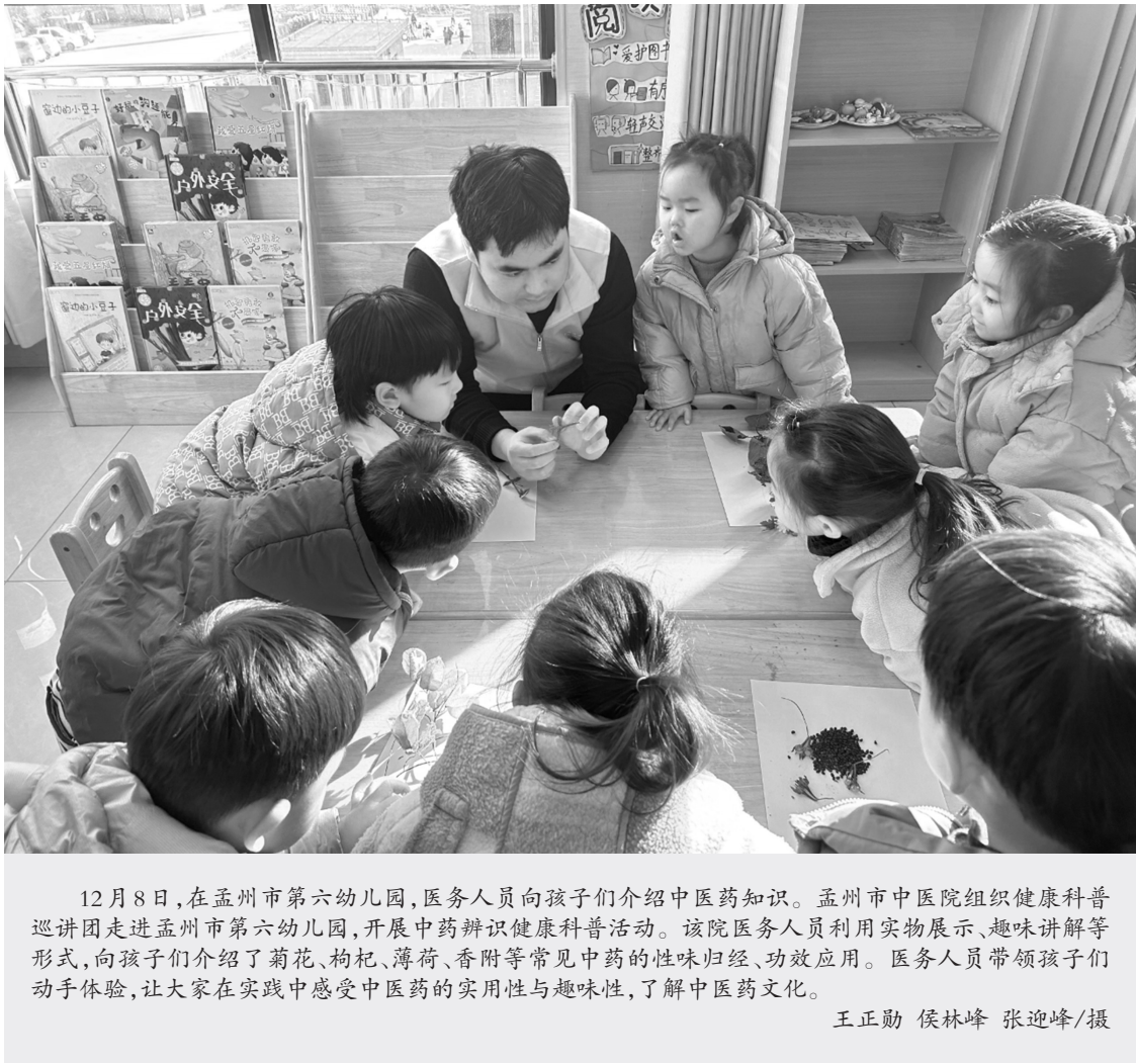
12月8日，在孟州市第六幼儿园，医务人员向孩子们介绍中医药知识。孟州市中医院组织健康科普巡讲团走进孟州市第六幼儿园，开展中药辨识健康科普活动。该院医务人员利用实物展示、趣味讲解等形式，向孩子们介绍了菊花、枸杞、薄荷、香附等常见中药的性味归经、功效应用。医务人员带领孩子们动手体验，让大家在实践中感受中医药的实用性与趣味性，了解中医药文化。

本报讯（记者赵忠民 通讯员林莎莎 白云川）近日，睢县中医院通过互联网医疗平台，成功联动郑州大学第一附属医院综合ICU（加强监护病房）专家，为80岁的重症患者开展远程会诊，让患者不出县便享受到省级医院的优质医疗服务。 据了解，该患者8年前因大面积脑梗死陷入昏迷状态，身体基础条件较差。前不久，患者无明显诱因出现气喘、呼吸急促等症状，家属紧急将其送至睢县中医院就诊。得知家属因担忧病情想要转至上级医院的想法后，医生结合患者的实际情况，耐心告知长途转运可能带来的风险，并提出通过医院互联网平台联动郑州大学第一附属医院专家进行远程会诊的解决方案。最终，省级医院专家结合患者实际情况给出了精准的用药指导和治疗优化建议，为后续救治提供了权威依据。