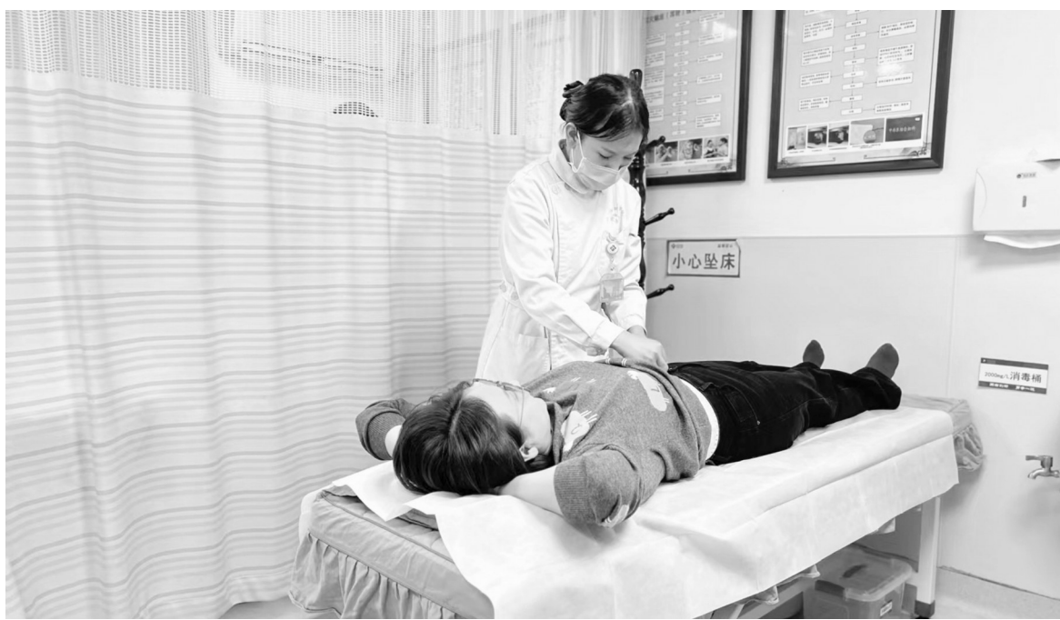
→4月5日,在焦作市妇幼保健院,医务人员为患者进行中药贴敷治疗。焦作市妇幼保健院积极推广中医药适宜技术,将中医药融入临床各个科室,更好地保障妇女儿童的健康。