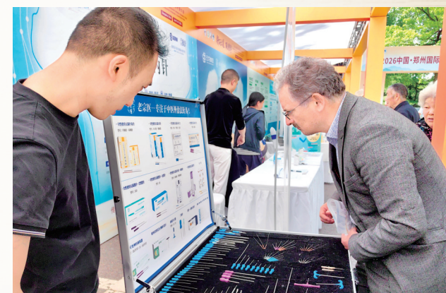
外国友人参观针具展示