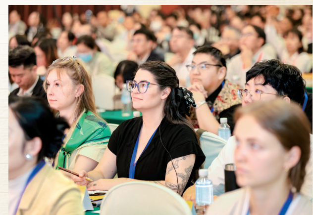
外国友人参加学术会议