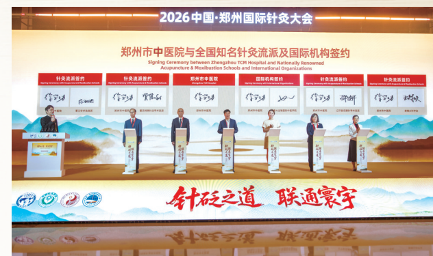
郑州市中医院与全国知名针灸流派及国际机构签约

郑州市将以建设具有国际影响力的中医针灸中心为牵引,持续深化国内外合作,加快人才引进与培养,推进技术研发和标准化建设,为中医药传承创新发展贡献郑州力量。