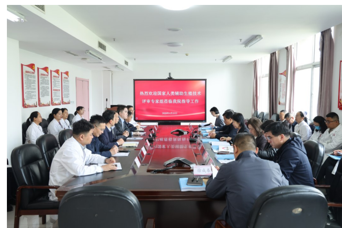
专家组听取汇报并现场提问

4月22日,洛阳市妇幼保健院(河南省第二儿童医院)全票通过PGD技术(植入前遗传学诊断,俗称“第三代试管婴儿”技术)正式运行现场评审。作为全省第四家、洛阳首家通过该技术正式运行评审的医疗机构,该院辅助生殖技术实现从助力孕育到精准优生的跨越式发展,标志着豫西地区辅助生殖技术、优生优育服务、遗传性疾病防治及出生缺陷防控水平迈上新台阶。