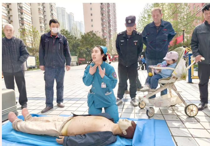
现场教授心肺复苏课程