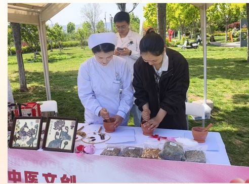
独具匠心的中医药文创作品