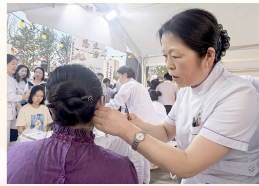
中医药适宜技术受群众欢迎

士、优秀护士长、“豫健护理”先进个人、优秀专科护士、优秀带教老师、优质护理服务先进集体、“豫健护理”先进集体、静脉穿刺能手、中医药护理技能比赛获奖者、中医药护理技术创新比赛获奖者、中医文创比赛获奖者、辨证施膳比赛获奖者，大家在掌声中回望既往、相互激励、倍感振奋。 北京中医药大学东直门医院洛阳医院(洛阳市中医院)全体护士将以先进为标杆，立足护理岗位，精进专业能力，传承护理职业精神，以更加务实的作风，用心守护群众健康，为医院高质量发展贡献护理力量。