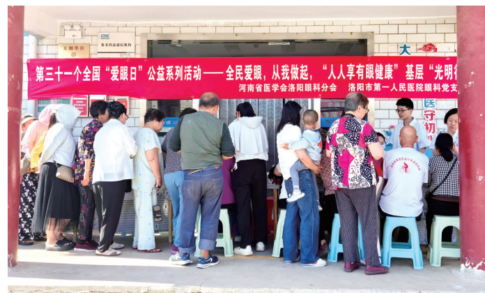
“爱眼日”公益系列活动现场