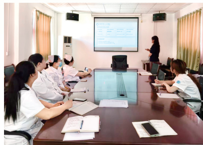
药品合理使用培训

下一步,洛阳市第一人民医院城市医疗集团将持续加强集团一体化建设,常态化、规范化开展基层惠民服务和医技赋能提升活动,持续细化下沉服务内容、拓宽服务覆盖面、提升服务精准度,补齐基层医疗服务短板,优化辖区医疗卫生服务体系,以更专业的技术、更优质的服务、更务实的举措守护辖区群众身体健康,为洛阳区域卫生健康事业高质量发展注入坚实力量。