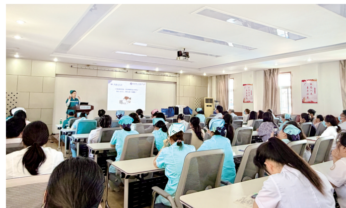
急诊急救业务培训

2025年12月9日,洛阳市第一人民医院城市医疗集团揭牌。该集团联合瀍河区、老城区区内等33家一级、二级医疗机构,社区卫生服务中心及乡镇卫生院共同组建,以“资源共享、协同发展”为原则,通过统一管理、远程协作、专家下沉、人员培训等机制,着力构建“基层首诊、双向转诊”的服务新格局,推动医疗资源均衡布局与服务同质化,为居民提供连续、优质、高效的医疗服务。